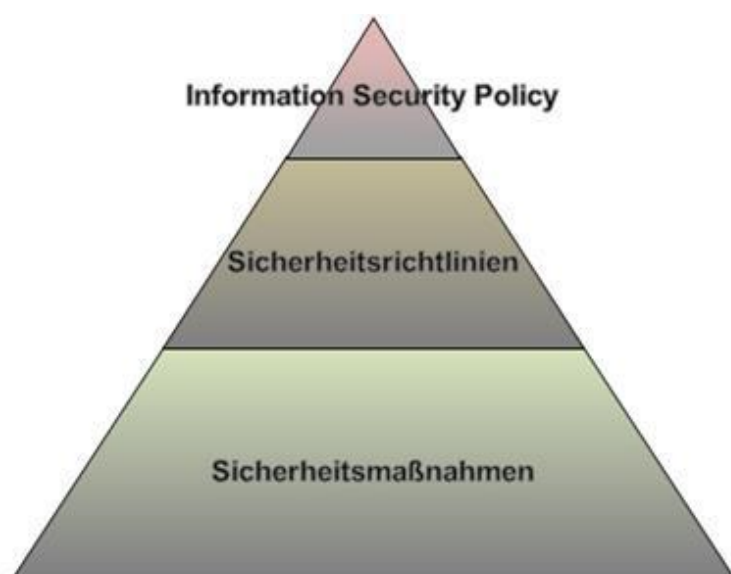
Abbildung 2: Informationssicherheits-Architektur der SVC

In der Informationssicherheits-Architektur wird festgelegt, wie die Informationssicherheit in der SVC umgesetzt wird.